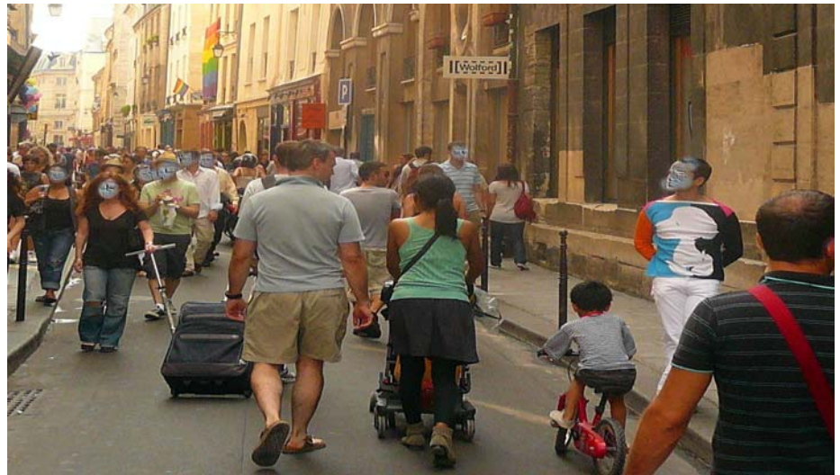
Rue Vieille du Temple (IVe), un dimanche

La vie dans le Marais est-elle toujours possible pour la communauté des gens ordinaires ?