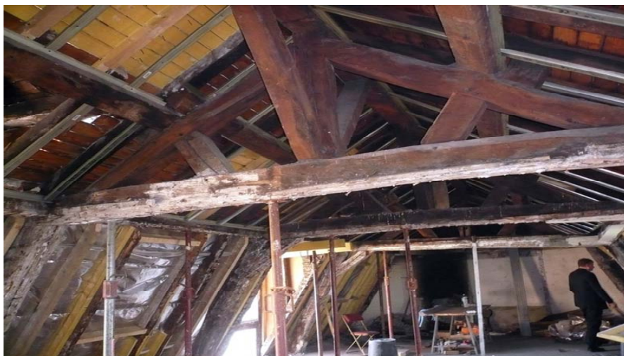
Nous sommes ici dans les combles, sous la charpente, de l'Hôtel du "Docteur MISSA", du nom de celui qui en fit l'acquisition en 1774.

Situé au 12 de la rue Barbette (IIIe), l'examen de ses caves voûtées incite à penser qu'elles constituaient en partie les soubassements de l'ancien « Hôtel Barbette », qui occupait à la fin du XIVE un vaste espace sur la rue actuelle.