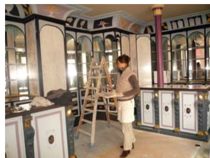
MAISON MEERT, 16 rue Elzévir - IIIe - 01 42 71 10 18

Placé tout près du musée Picasso, sur le trajet de Carnavalet, avec à ses